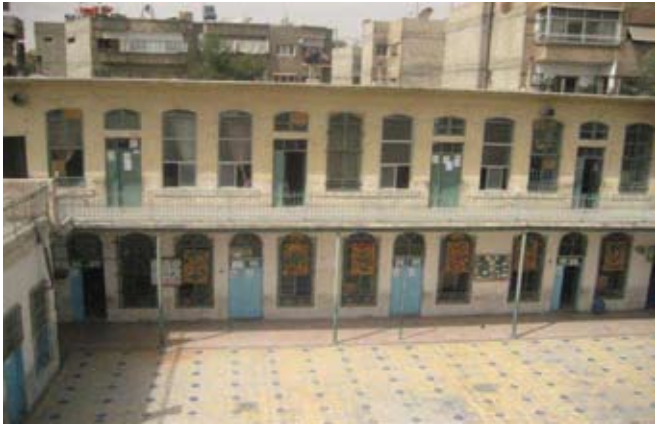
האכסניה בג'ובר שהפכה למרכז חינוכי