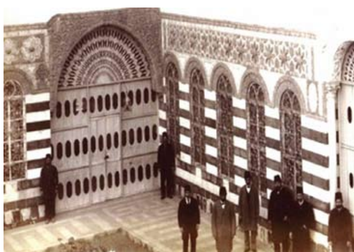
בית ענבר שהפך למכתב - בית מדרש לכהני דת מוסלמים