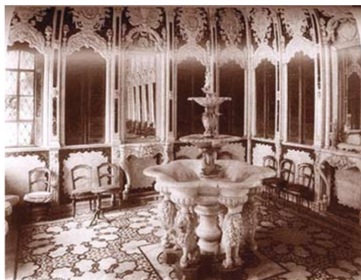
בית שמעיה אנג'ל (ויקיפדיה)