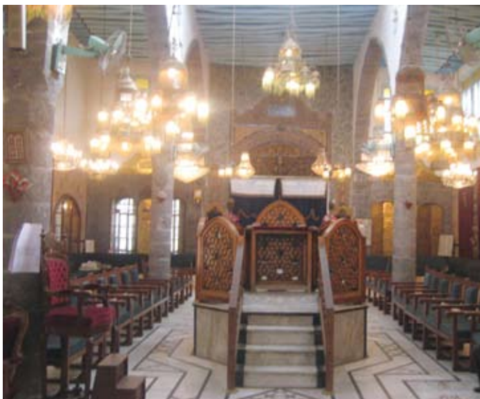
בית הכנסת אל פרנג'