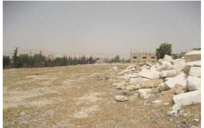
בית העלמין ש"גולח" להכשרתו לנדל"ן ובניית דרך (אוהלי צדיקים)