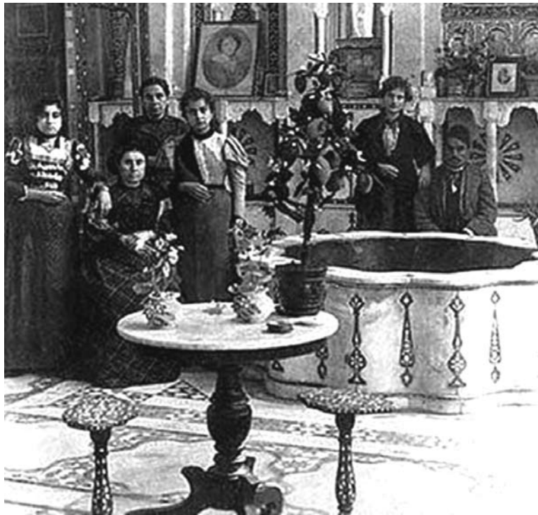
בית משפחה יהודית בדמשק 1901